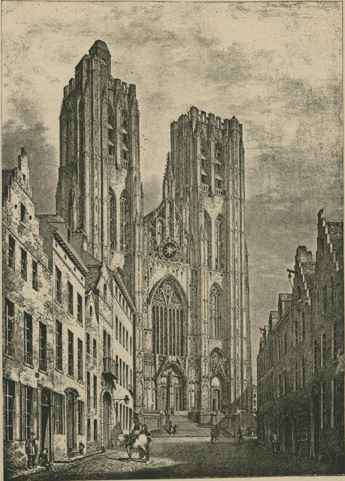
L'ÉGLISE DES SS. MICHEL ET GUDULE AVEC L'ESCALIER DE 1703, ET AVANT LA RESTAURATION DE LA FAÇADE. Réduction de la gravure de Gustave Simonau.